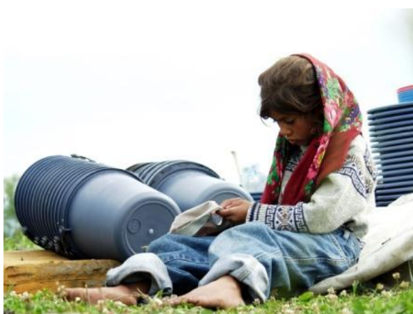
Fig. 3 Fetiță la groapa de gunoi din Deva

După două ediții naționale de succes (2005/2006, 2007), CJi a inițiat o variantă regională a programului Presă și accesul la sănătate în comunitățile de romi . Proiectul și-a propus să crească vizibilitatea problemelor de sănătate ale comunităților de romi din regiune și să promoveze o abordare mai largă a acestui subiect, punând problema accesului la serviciile de sănătate într-o perspectivă mai generală - reducerea sărăciei, incluziunea socială, lupta împotriva corupției, etc. Jurnaliștii din regiune s-au familiarizat cu politicile publice de sănătate referitoare la comunitățile de romi. Nu în ultimul rând, proiectul a sprijinit activitatea de investigație în scopul creșterii numărului de materiale despre acest subiect, în media națională și locală. Materialele realizate în cadrul programului sunt disponibile în limba engleză, dar și în limba țărilor incluse în program (Bulgaria, Macedonia, Romania, Serbia și Ucraina). Investigațiile au fost coordonate de Paul Radu ( Centrul Român pentru Jurnalism de Investigații ).