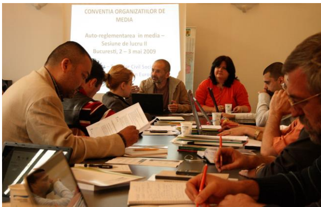
Fig. 1 Întâlnirea Convenției Organizațiilor de Media, mai 2009

cadrul programului au fost realizate următoarele documente: