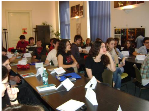
Fig. 2 Participanți la Școala de vară, 13-19 iulie 2009

Beneficiarii direcți au fost liceenii și cadrele didactice din București, Constanța și Craiova , orașe în care s-au organizat cursuri de educație civică, jurnalism și management editorial. Programul a mai inclus o școală de vară, desfășurată la București, în luna iulie.