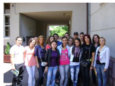
Participanții la cursul Rasismul în presă, Deva, iunie 2010