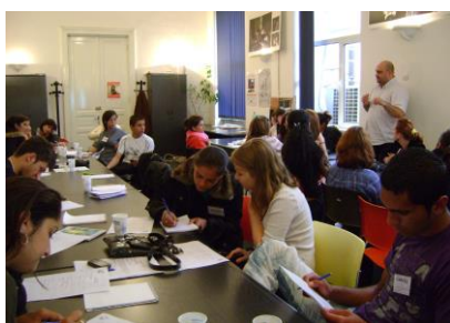
Rasismul în presă, București, aprilie 2010

În a treia etapă a programului, cei mai activi jurnaliști participanți la etapele naționale vor lua parte la un workshop internațional , care se va desfășura la Praga .